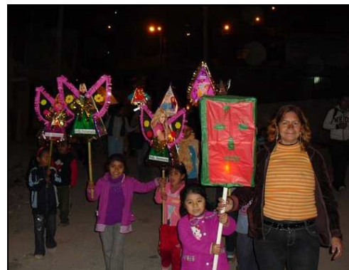
Come da tradizione in Perù, la vigilia di un anniversario è il momento della fiaccolata, e anche noi percorriamo, la sera, le strade del quartiere con le nostre lanterne.