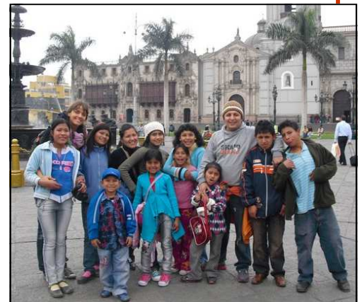
Una gita scolastica è un'ottima occasione per stare assieme, passare una giornata diversa e conoscere meglio la città in cui viviamo.