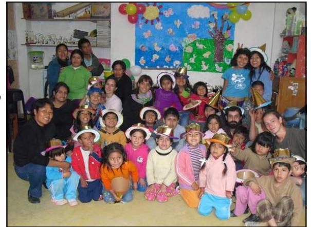
Il compleanno della scuola è la festa di tutti: lo celebriamo con musica, torta e regali!

Cari amici, in questo quarto numero del Carrito abbiamo deciso di limitare il più possibile le parole, per lasciare spazio alle immagini. Sono immagini di festa, perché il Programma Educativo è giunto al suo terzo anno di vita, e all'inizio di settembre abbiamo festeggiato il suo (e nostro) compleanno con una serie di iniziative che hanno coinvolto i bambini e adolescenti della scuola e del gruppo, gli educatori, i genitori, la comunità. Sono stati dei giorni allegri e importanti, che hanno contribuito a creare un senso di appartenenza ad un progetto che poco a poco, tutti assieme, stiamo aiutando a crescere.