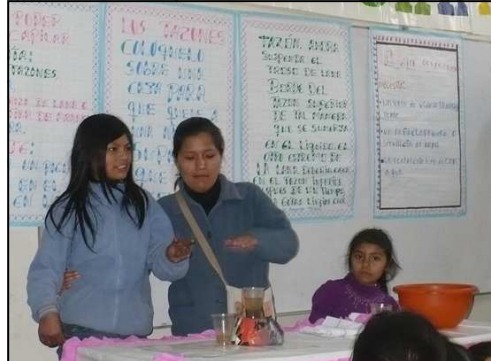
L'esposizione di scienze: studiamo, proviamo, e mostriamo a tutti il nostro esperimento.